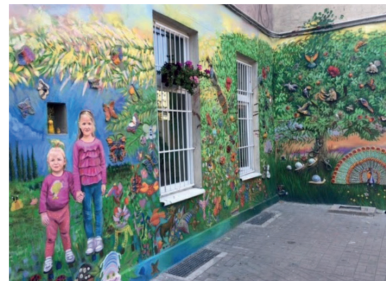
Podwórko między ulicami Roosevelta i Jedności Narodowej

Osiedle usytuowane na prawym brzegu Odry stało się w ostatnich latach mekką artystów. Stawni streetartowcy realizują na ścianach kamienic monumentalne przedsięwzięcia – wielkoformatowe murale. Przytącają się do nich mieszkańcy, którzy własnymi pracami współtworzą barwne podwórka. W niepowtarzalną atmosferę Nadodrza wpisują się otwarte pracownie artystyczne i rzemieślnicze oraz klimatyczne kawiarenki, które często pełnią rolę galerii sztuki. Znajdziesz tu niebanalne prezenty, oryginalne ubrania od polskich projektantów i najlepsze w mieście wegańskie jedzenie.