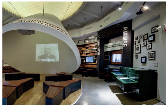
Visitor Centre

obiekcie. Na wystawę składają się dotykowe ekrany i mapy, filmowe i dźwiękowe nagrania, a także dwie wirtualne wycieczki opracowane w technologii virtual reality. W ich trakcie poznasz samego architekta Hali Stulecia – Maxa Berga, zajrząz do miejsc niedostępnych dla zwiedzających, a także, co najbardziej ekscytujące, wzbijesz się ponad Halę i Igllicę, aby z wysokości poznać kompleks Hali Stulecia i obejrzeć niewiarygodną panoramę Wrocławia.