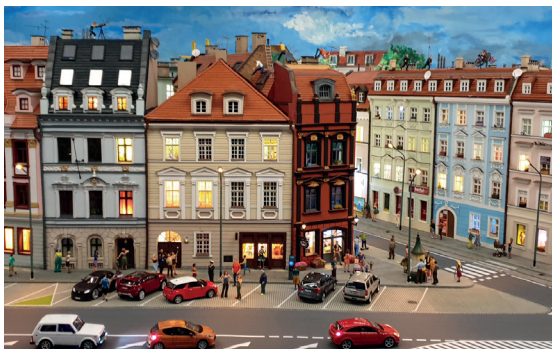
Wrocław w miniaturowym modelu, fot. ze zbiorów Kolejkowa

Nie musisz interesować się kolejnictwem, żeby poczuć dreszczyk emocji na widok tej największej w Polsce makiety kolejowej. Precyzyjnie odwzorowane parowozy, wagoniki, wiadukty, tory, rozjazdy, perony i dworce... Miniaturowe pociągi pędzą przez Wrocław i Dolny Śląsk, dzięki czemu możesz poznać cały region z tej niezwykłej perspektywy. Zobaczysz codzienne życie mieszkańców Wrocławia, odwiedzisz atrakcje turystyczne, w mgnieniu oka przeniesiesz się z wrocławskiego Rynku na Śnieżkę. Ekspozycja stale się zmienia, aby jak najdokładniej odwzorowywać rzeczywistość. Wystawa mieści się w Sky Tower – jednym z najwyższych budynków Wrocławia (warto wjechać na taras widokowy na ostatnim piętrze).