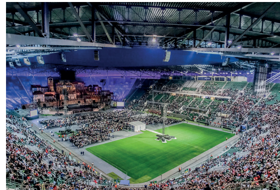
Tarczyński Arena

Oryginalna bryła stadionu przypomina chiński lampion. Obiekt, który powstał z okazji EURO 2012, to miejsce wielu wydarzeń sportowych, muzycznych, rodzinnych i artystycznych. Tarczyński Arena to nie tylko stadion, to atrakcja turystyczna, którą możesz zwiedzać (w ten sposób poznasz zakamarki i miejsca na co dzień niedostępne). W kompleksie stadionu dostępnych jest wiele atrakcji niezwiązanych z futbolem: gokarty (tor kartingowy Le Mans), skoki na linie (Dream Jump), Arena Gigantów. Na dzieci czeka park rozrywki z dmuchańcami, zjeżdżalnią i torem przeszkód.