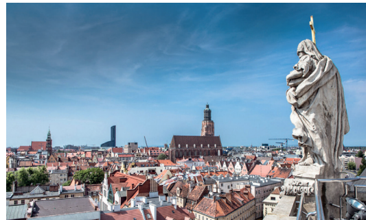
Widok z Wieży Matematycznej, fot. ze zbiorów WPM UMW

Jeśli chcesz zobaczyć, jak wygląda Wrocław z góry, odwiedź jeden lub kilka z wrocławskich punktów widokowych. Najciekawsze z nich to: taras widokowy na 49. piętrze Sky Tower (na wysokości ok. 200 m, wjazd windą), z którego oprócz Wrocławia można zobaczyć także Śnieżkę, Ślężę czy górę Chełmiec; Mostek Pokutnic, czyli kładka łącząca dwie wieże kościoła św. Marii Magdaleny (na wysokości 45 m, wejście schodami); taras na Wieży Matematycznej w gmachu głównym Uniwersytetu Wrocławskiego (na wysokości 42 m, wejście schodami); wieża kościoła garnizonowego św. Elżbiety (na wysokości 75 m, wejście schodami); wieża wrocławskiej katedry na Ostrowie Tumskim (na wysokości 97 m, wjazd windą); punkt widokowy na przeszklonym dachu biurowca Concordia Design (na wysokości 20 m, wjazd windą).