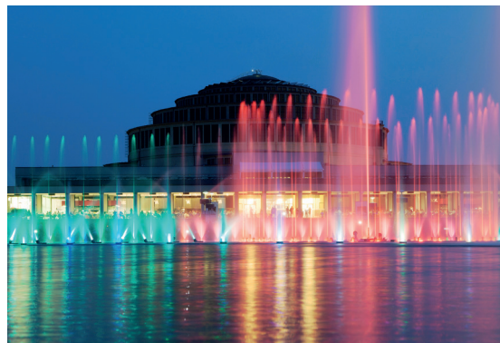
Fontanna multimedialna, fot. ze zbiorów WPM UMW

Obok Hali Stulecia od wiosny do jesieni odbywają się pokazy fontanny multimedialnej , która jest największym w Polsce i jednym z największych tego typu obiektów w Europie. Konstrukcja zajmuje powierzchnię blisko jednego hektara, a na jej dnie umieszczono punkty świetlne, trzysta dysz wodnych oraz trzy dysze ogniowe. Wodnym widowiskom towarzyszy muzyka. Uroczyste otwarcie fontanny odbyło się 4 czerwca 2009 r. z okazji dwudziestej rocznicy pierwszych wolnych wyborów w powojennej Polsce.