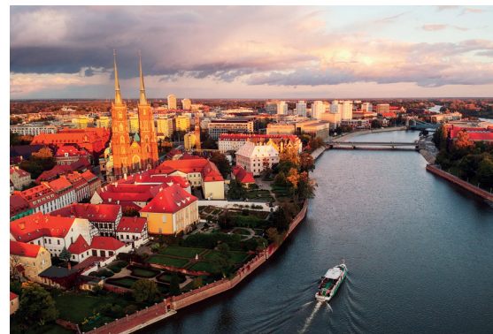
Rejsy po Odrze, fot. ze zbiorów WPM UMW

Rejsy po Odrze to świetny sposób na poznanie Wrocławia w mniej oczywisty sposób. Zwiedzając miasto od strony rzeki, zrozumiesz, dlaczego Wrocław nazywany jest Wenecją Północy. W rejs możesz się wybrać dużym statkiem wycieczkowym lub mniejszym stateczkiem, nowoczesną motorówką lub ekologiczną łodzią napędzaną bateriami solarnymi. Przystanie znajdziesz w centrum miasta, w pobliżu atrakcji turystycznych. Wrocław od strony rzeki możesz także podziwiać podczas wycieczki kajakami, łodzią wiostową czy niewielką motorówką. Wypożyczalnie sprzętu wodnego działają od maja do późnej jesieni.