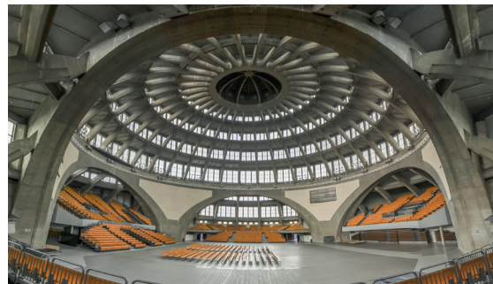
Hala Stulecia

Hala Stulecia (niegdyś Hala Ludowa) to wpisana na listę UNESCO monumentalna budowla z betonu z 1913 r. Zaprojektowana przez Maxa Berga, była ponad sto lat temu prawdziwą rekordzistką: miała największą na świecie kopułę (o średnicy 65 m) i największe organy. Znajdowało się w niej pięć tysięcy miejsc siedzących.